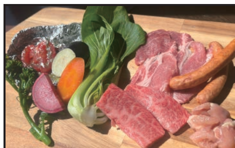
● プチエールセット 3,300円 野菜のホイル焼きと デザートつき！