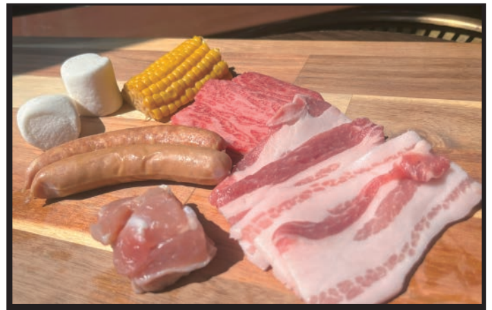
● キッズセット 2,500円 小学生のスタンダードメニュー