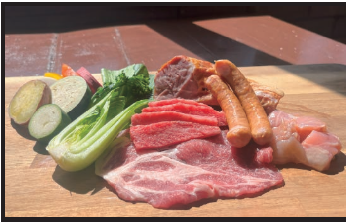
● コスパセット 3,300円 大人（中学生以上）のスタンダードメニュー